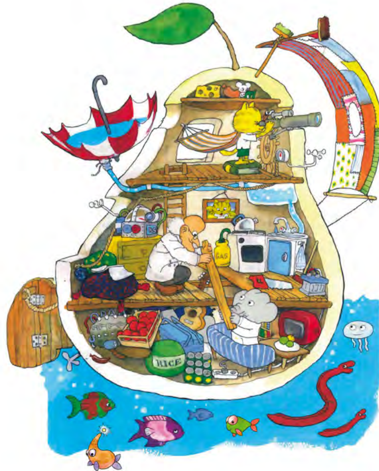
ILLUSTRATION © Jakob Marim Strid